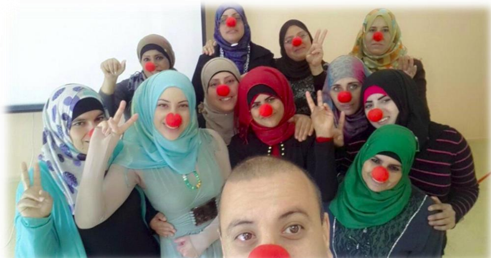
إنهاء مساق لفرقة متخصصة بالترفيه لذوي الإعاقة العقلية التطورية (تل السبع، ٢٠١٥)

في بناء البرامج، هناك تركيز حول التكيف الثقافي والديني بحسب الحاجة.